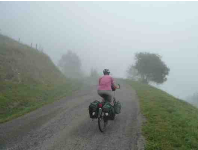
5 In de mist op de Col d'Azet