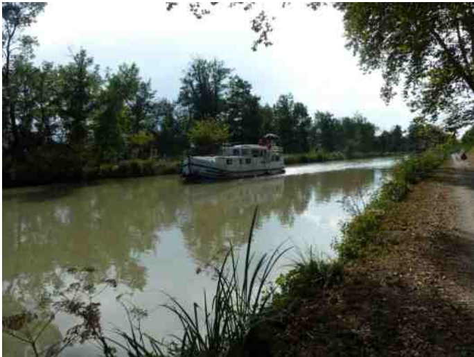
9 Fietsen langs het Canal du Midi

Na flink wat extra hoogtemeters kwamen we toch nog mooi op tijd aan op Camping du Rupé in Toulouse. Nog een dagje Toulouse en dan de terugvlucht. En net als in Ajaccio toch weer een probleem om de fietsen te scannen. Ik had de dag tevoren nog gevraagd of het voorwiel ook verwijderd moest worden, en dat hoefde niet. Gelukkig wist de fietsvriendelijke medewerker met behulp van heel veel kunststofkratjes de fietsen toch door de scanner te geleiden.