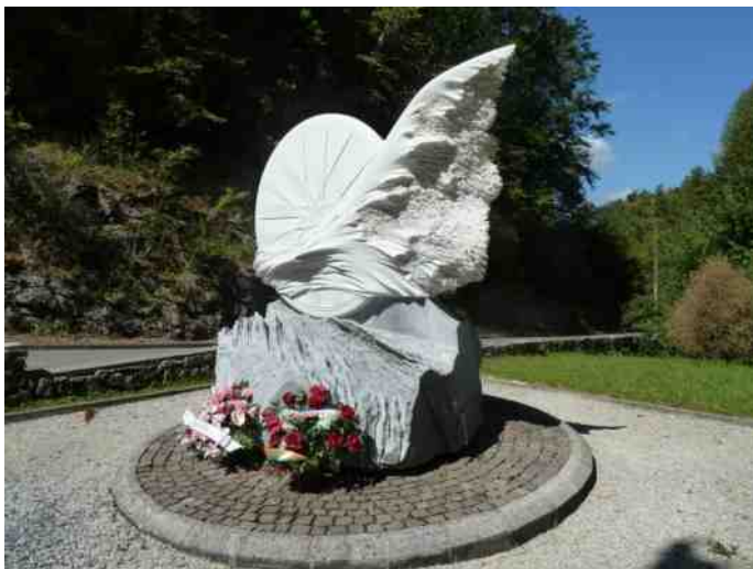
Monument van Fabio Casartelli