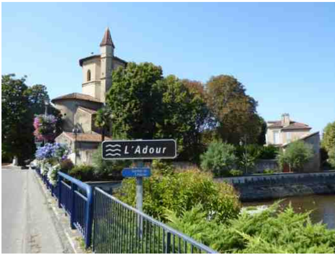
We kruisen de l'Adour bij Maubourguet