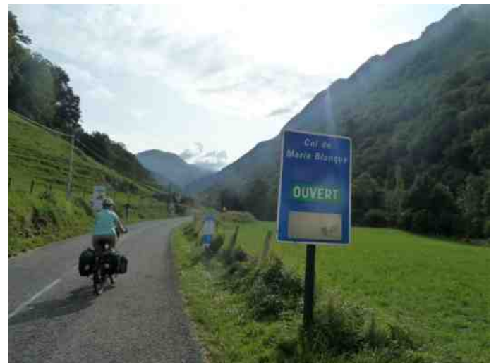
De eerste klim van de "Route des Cols"

De Col des Bordères is eigenlijk een "keuzecol". In de Route des Cols heb je enkele cols die je niet kunt vermijden, maar hier hadden we ook via Argelès-Gazost naar de Col du Tourmalet kunnen fietsen. Maar we zijn nu eenmaal in de Pyreneeën voor de cols en daarom is de route via "Achterberg" geen optie. De [3]Col des Bordères (1156m/+767m, 5,5km, gem. 4,3%, max.13%), stelt niet zoveel voor behalve dan een supersteil stuk na de brug over de Gave d'Azun. Al vanaf de camping hadden we prachtige uitzichten op de hoge bergen die schitterden in de ochtendzon. Na de col daalden we erg mooi af naar het dal van de Gave de Pau. De Gave de Pau wringt zich hier door de Gorges de Luz en helaas kan de drukke, smalle weg niet worden vermeden.