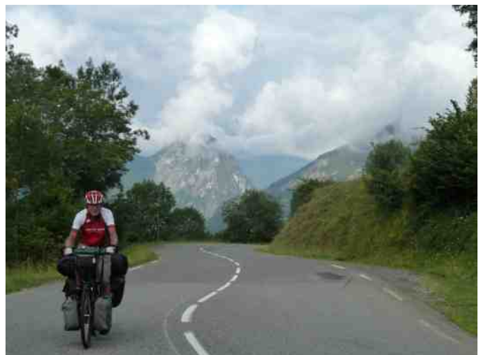
Klim naar de Col de Menté

Bij Aulus-les-Bains begint de [13]Col d'Agnes (1570m/+828m, 10,2km, gem. 8,1%, max.13%). Deze col is de eerste 3 km erg steil, maar daarna blijft die rond de 9%. Op 1400 meter heb je het Plateau de Coumebière, ook een Natura2000-gebied. Vanaf de col keek je mooi op de besneeuwde noordhellingen van de hoofdkam. Na een korte afdaling vonden we een prachtige lunchplek aan het Étang de Lers, een populaire picknickplek. Iets verderop was ook een startplaats voor parapenters. De Port de Lers (1517m) is een serieuze klim vanaf Tarascon-sur-Arièges (480m), maar van onze kant stelt het niets voor. In de afdaling kwamen we veel fietsers tegen die de klim deden met een georganiseerde tocht. De snelle klimmers zagen er boven nog goed uit, maar naarmate we verder afdaalden waren de fietsers behoorlijk afgetekend. Ik denk niet dat de laatsten de col hebben gehaald. De afstand van de col tot Tarascon was nog zo'n 26 km, maar de afdaling van 1000 meter verliep zonder een enkele tegenstijging, zodat we met een onweersbui in de rug een ongekend hoog tempo