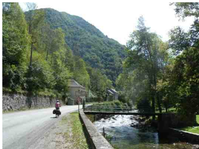
8 Idyllisch fietsen langs Le Salat richting Col de Latrape

Bij Bram loopt langs het Canal du Midi een jaagpad, een 'chemin de service', verboden voor alle verkeer. Net als andere fietsers trokken we ons hier niets van aan. Tot Castelnaudery was het jaagpad een gravelweg, maar we konden toch goed tempo maken. Wel leuk om steeds weer een sluis te passeren en de boten te zien varen. De camping in Castelnaudery was net gesloten, maar 6 km terug was nog wel een camping open, maar nu weer geen supermarkt of restaurant. We moeten toch wat structureler een noodmaaltijd meenemen. 's Nachts barstte een zware onweersbui los. We hadden onze tent op de goede plek gezet. Onze buurman, waarschijnlijk een gastarbeider, hoorden we 's nachts hozen. De volgende ochtend dan verder langs het Canal du Midi. Eerst nog wat slecht asfalt en daarna een kleipaadje. Na de regen van vannacht was het nogal modderig geworden en al snel liepen onze spatborden vol. Na de spatborden weer te hebben vrijgemaakt, hielden we het Canal du Midi maar voor gezien en zijn we binnendoor, dus heuveltje op, heuveltje af naar Toulouse gefietst. Ook een mooie route. Thuis zagen we dat als we na een paar kilometer naar het kanaal waren teruggefietst we een officiële fietsroute hadden gehad die waarschijnlijk voor het grootste deel tot Toulouse geasfalteerd zou zijn geweest. Je merkt dan dat thuis op het grote scherm het overzicht toch veel beter is dan op de Garmin GPS.